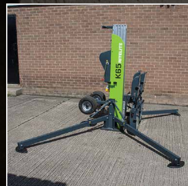
Base estable a lo largo de su configuración