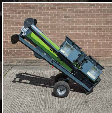
Fácil de maniobrar