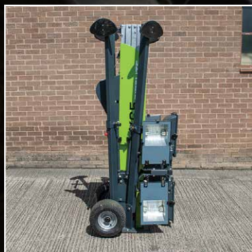
Fácil y compacto para guardar y transportar

Sistema de despliegue unipersonal en menos de 3 minutos