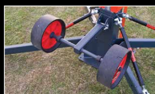
Ruedas de Perfil Bajo Para superficies duras / secas

Dos opciones de rueda estándar se ofrecen para proporcionar la máxima estabilidad, el manejo óptimo y un impacto mínimo con el suelo en una gama amplia de superficies.