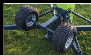
Ruedas Neumáticas para césped o superficies irregulares

Fundada en 1988, Ritelite (Sistemas) Ltd es una empresa especialista en equipos de iluminación portátil y móvil con más de 80 años de experiencia en la industria.