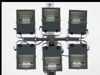
Cabezales de Luz de Haluro Metálico